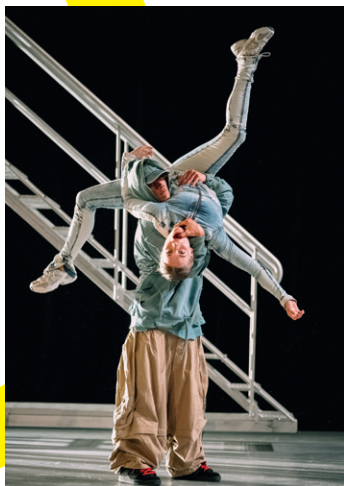
(LA)HORDE & le Ballet national de Marseille, Age of Content

« Le collectif semble bien parti, avec ses Matins intérieurs , pour jouer dans la cour des grands. »