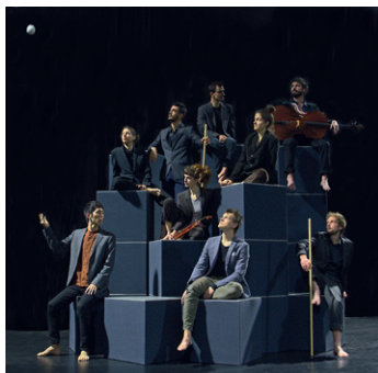
Collectif Petit Travers & le Quatuor Debussy, Nos matins intérieurs