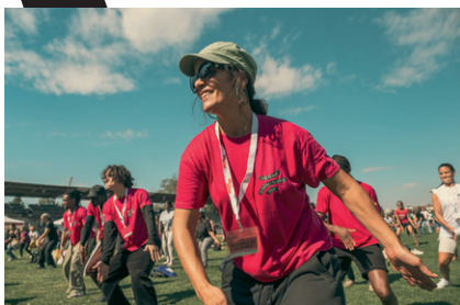
Cours de danse