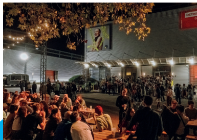
Usines Fagor, Lyon 7

« Grandiose autant qu'éphémère, un lieu bien particulier est placé au cœur de la 20 e édition de la Biennale de la danse de Lyon (...) : Fagor (...) à la fois l'épicentre festivalier de la Biennale, le site d'animations continues et un lieu de spectacles. »