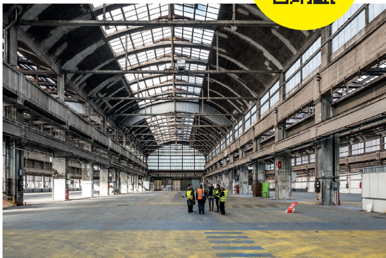
Les Grandes Locos, La Mulatière